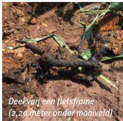
Deel van een fietsframe (2,20 meter onder maaiveld)

uit te voeren. Dat betekent: ter plekke metingen verrichten en alle objecten die we 'zien' direct lokaliseren, plus de overige gemeten data met speciale software later interpreteren. Als daaruit verdachte objecten naar voren komen, spreken we met de opdrachtgever af wanneer we die benaderen en verwijderen. Mijn taak is ervoor te zorgen dat dit op de projectlocatie allemaal veilig gebeurt.'