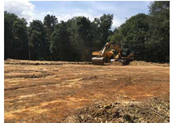
Ten (zuid)westen van het Gibraltarven is de grond weer geschikt gemaakt voor heide. Er is bos gekapt en bovenste 10 centimeter van de bosbodem is verwijderd. Daarna is gemalen heide uitgestrooid om nieuwe heideontwikkeling te stimuleren.